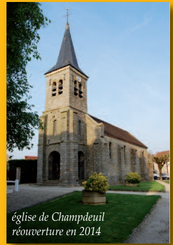
église de Champdeuil réouverture en 2014

Les églises de Soignolles et Champdeuil sont fermées dans l'attente de travaux.